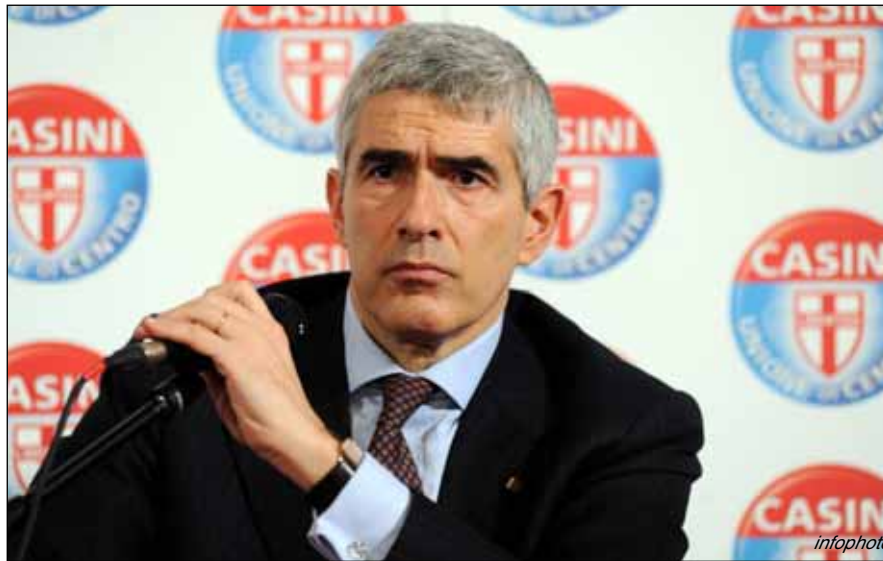
Pier Ferdinando Casini, leader dell'Udc

«Di litigi, di risse e polemiche il Paese non ne ha bisogno, ha bisogno invece che chi governa lo faccia» ha insistito Casini. Il numero uno dell'Udc ha sottolineato poi che «l'estate passata è stata penosa, caratterizzata solo dai loro litigi, ossia da chi è in maggioranza». Ora, ha aggiunto, «finita l'estate, speriamo che i colpi di soli siano esauriti. Se sanno farlo governino, se no se ne vadano a casa». «L'Italia non ha bisogno di sentire chi governa che litiga dalla mattina alla sera, ha bisogno che i pro-